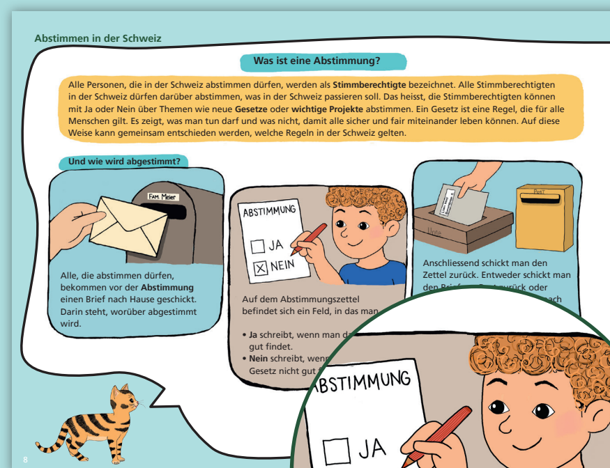
Blick ins Buch