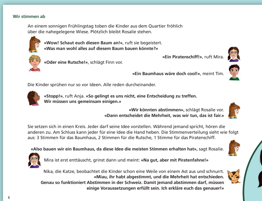
Blick ins Buch

Aus der theoretischen Auseinandersetzung ging hervor, dass Kinder Inhalte besser verstehen, wenn diese an ihre Alltagserfahrungen anknüpfen. Daraus entwickelte ich ein Buchkonzept, das erzählerische Szenen aus dem Alltag von Kindern mit informativen Sachseiten kombiniert.